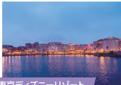
東京ディズニーリゾート

新鎌ヶ谷駅から電車で 約20分 634mの日本で一番高いタワー「東京スカイツリー」。商業施設やプラネタリウム、水族館などもあり、老若男女・国内外の観光客から大人気です。