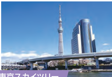
東京スカイツリー

新鎌ヶ谷駅から電車で 最短38分 スカイライナーを利用すれば、最短38分。人気の丸の内「東京ビルTOKIA」や「丸の内トラストシティ」など、大人が楽しめるオシャレなスポットが満載です。