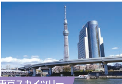
東京スカイツリー

新鎌ヶ谷駅から電車で 最短38分 スカイライナーを利用すれば、最短38分。人気の丸の内「東京ビルTOKIA」や「丸の内トラストシティ」など、大人が楽しめるオシャレなスポットが満載です。